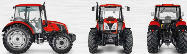
12/12 Wendegetriebe (Bereifung hinten 18,4 R34)